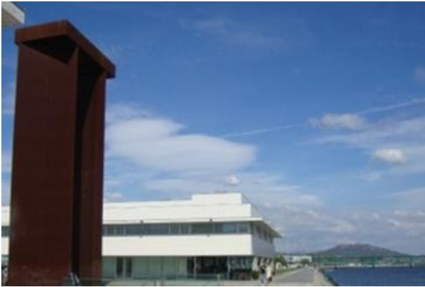
Partida: Praça da Liberdade (0 km)