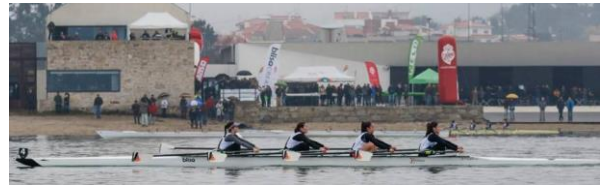
Chegada: Centro de Remo (6,5 Km)