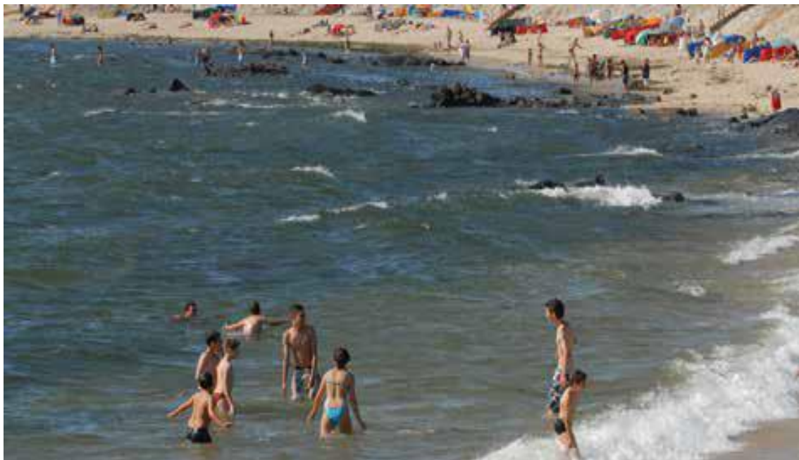
PRAIA NORTE - Praia oceânica de bandeira azul. Praia com qualidade de ouro.