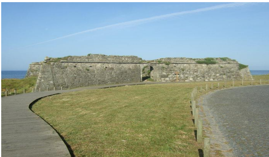
CASTELO VELHO - Forte de Rego de Fontes.

VRL - Fundado em 21 de Março de 2012 (Fusão do Clube Náutico e Arco de Viana)