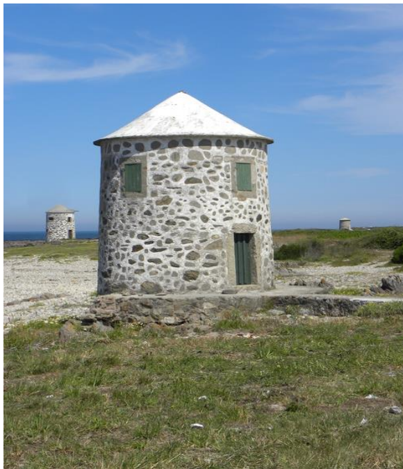
MOINHOS DE VENTO – Zona dos Moinhos.