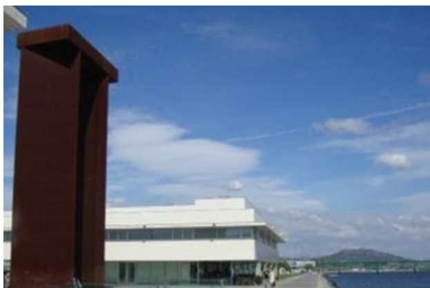
Partida: Praça da Liberdade (0 km)