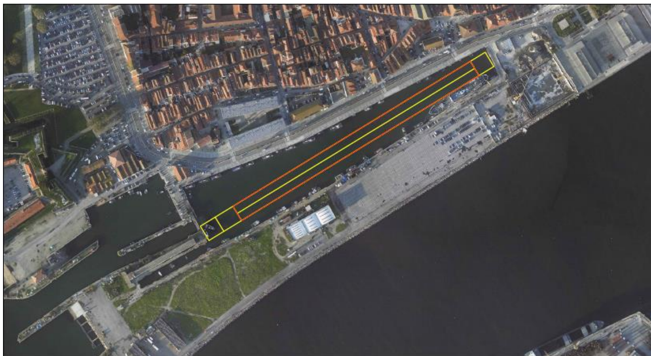
Perfil Pista Doca Gil Eanes (400 metros Sprint)