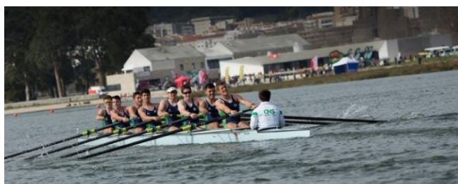
Chegada: Centro de Remo (6,5 Km)