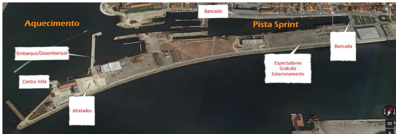
Mapa Geral Campo de Regatas SÁBADO