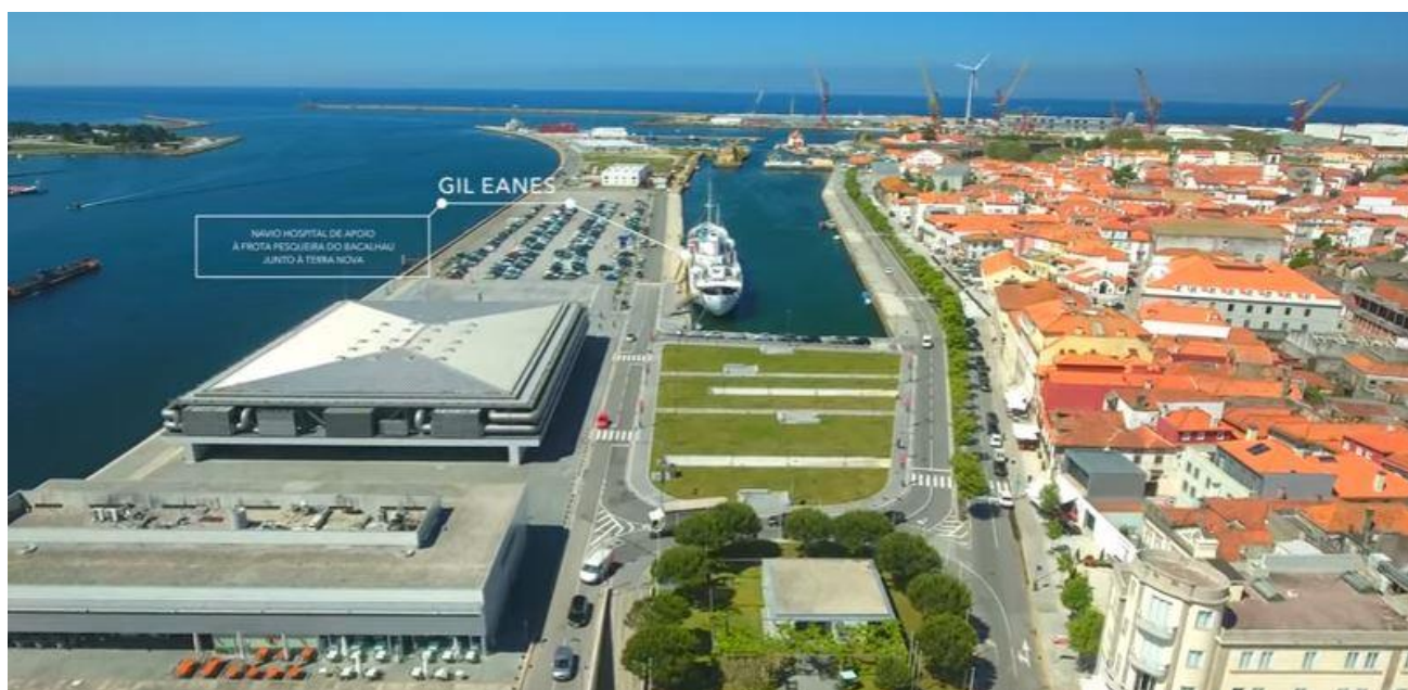
Doca Navio Gil Eanes