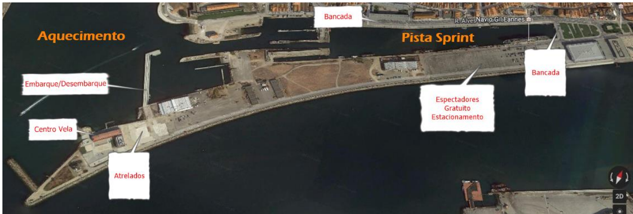
Mapa Geral Campo de Regatas SÁBADO