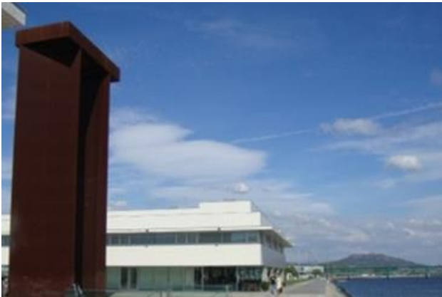
Partida: Praça da Liberdade ( 0 km)

DOMINGO – 12 de fevereiro - Estuário Rio Lima (Frente Praça Liberdade- Ponte A28 - Centro Remo) Fundo – 6,5 km