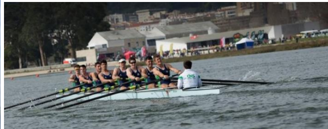
Chegada: Centro de Remo (6,5 Km)