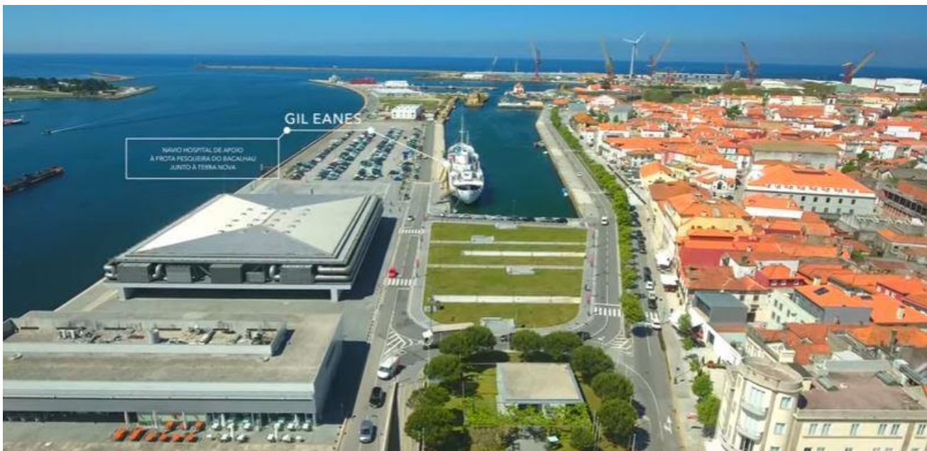
Doca Navio Gil Eanes